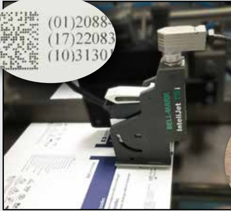
Montage an einer horizontalen Beuterverschließmaschine